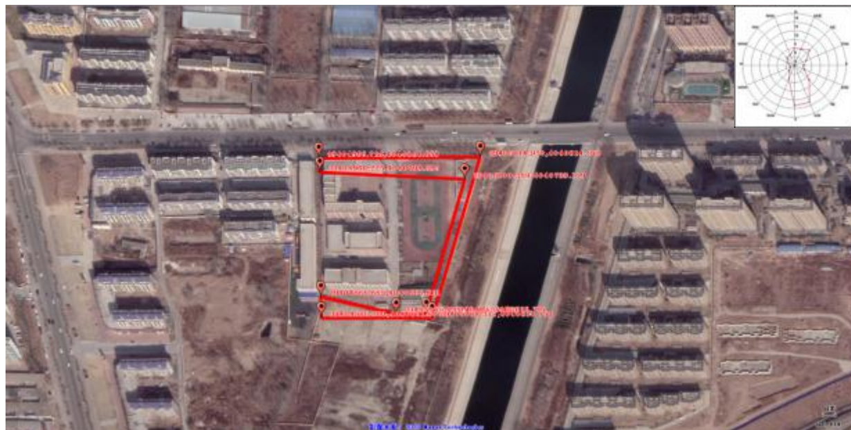
图 2.4-1 项目壤污染状况调查范围图