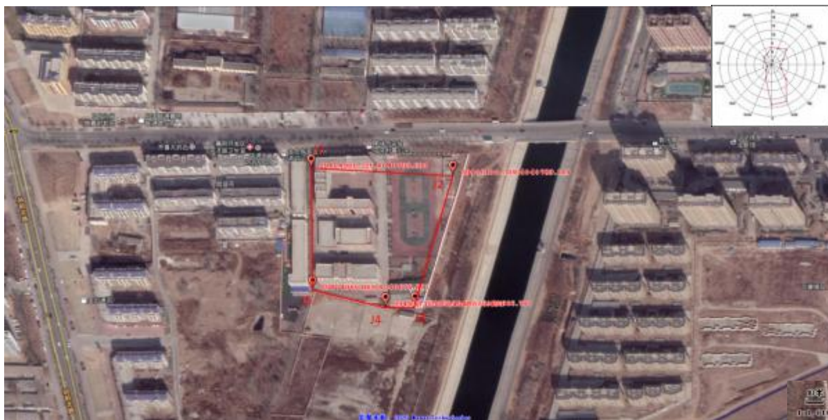
图 2.4-1 项目壤污染状况调查范围图